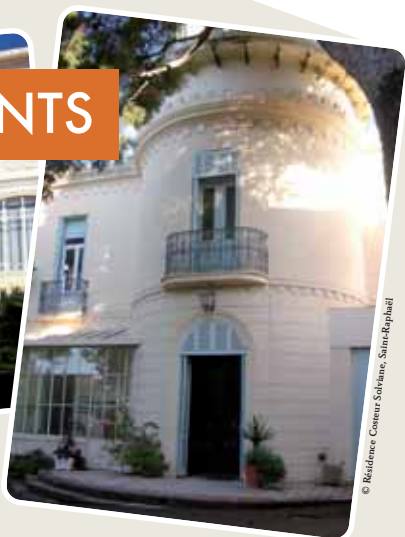
© Résidence Coeur Sobriane, Saint-Raphaël