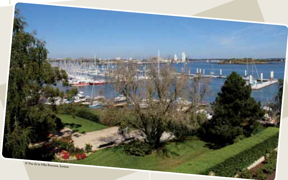
© Vue de la Villa Kerozen, Lorient